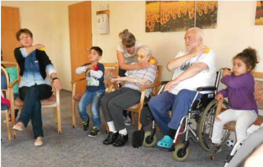
Abb. 10: „Mitmachgeschichte“: sich spüren und spüren lassen