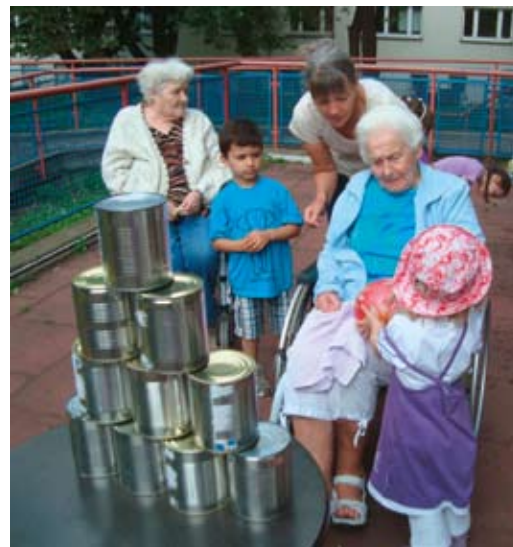
Abb. 9: „Dosenwerfen“: Erfolg durch Kooperation und Regelvariationen