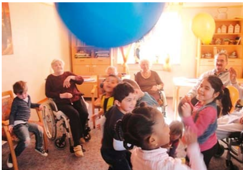
Abb. 4: „Tanzende Luftballons“: Aktivierung mit geringen Mitteln

Die Spielleiter_in sorgt auch für den Übergang zur Entspannungsphase, indem die Luftballons nacheinander aus dem Spiel rausgenommen werden. Danach herrscht meist Ruhe.