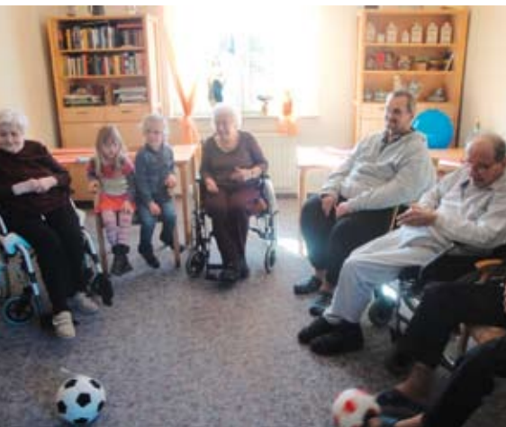
Abb. 3: „Fußball mal anders“: Bekannte Spiele neu überdenken und modifizieren

Die Regeln lassen sich individuell modifizieren: