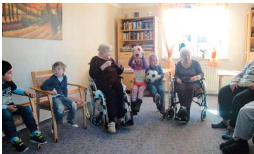
Abb. 2: Begrüßung, gegenseitige Wahrnehmung und (Be-)Achtung

Hier beginnt das eigentliche Thema „Fußball mal anders“. Wichtig ist es, Spielideen der Kinder und Senior_innen zu berücksichtigen. Die Ideen werden aufgegriffen und flexibel in die Stunde eingebaut: Der Softball ist auf den Boden gefallen, das Kind schießt den Ball dem Anderen mit den Füßen zu. So ist das Spiel „Fußball mit dem Softball“ entstanden. Kinder können im Stehen spielen, Senior_innen im Sitzen. Wichtig ist, darauf zu achten, dass das Fußgestell der Rollstühle zur Seite geklappt wird, um das Mitspielen unbehindert zu ermöglichen. Damit mehr Bewegung in das Spiel kommt, kann ein zweiter oder – falls notwendig – auch ein dritter Ball dazugegeben werden (Abb. 3, S. XXX).