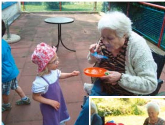
Abb. 7 und 8: „Seifenblasenspiel“: jeder mit seinen Möglichkeiten und Ideen