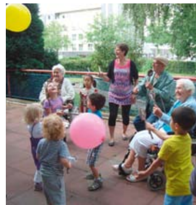
Abb. 5: „Fliegende Ballons“: Kreative Ideen und Kooperation

Für Variationen und Erweiterungen bietet sich das Spiel mit Luftballons, Seidentüchern oder Schwungtuch an. So besteht z. B. die Möglichkeit, die Spannung langsam aufzubauen, in-