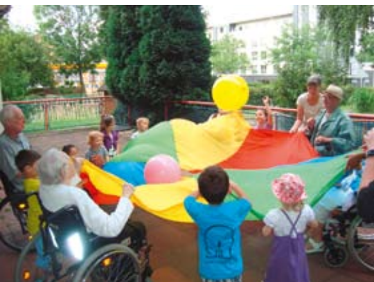
Abb. 6: „Spiel mit dem Schwungtuch“: Jeder Einzelne ist wirksam.